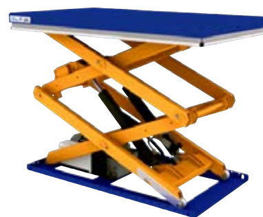
Nouvelle TLD 1000 avec deux cylindres.

L'UC 60 seront également mis en place, courant 2010, ce qui ajoute beaucoup de valeur aux produits.