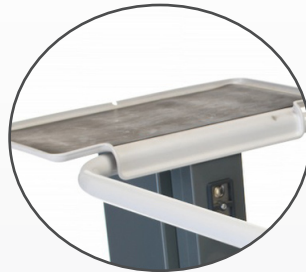
Avlastningsbricka för verktyg och material